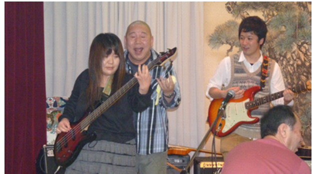
写真はいずれも新年会 2012